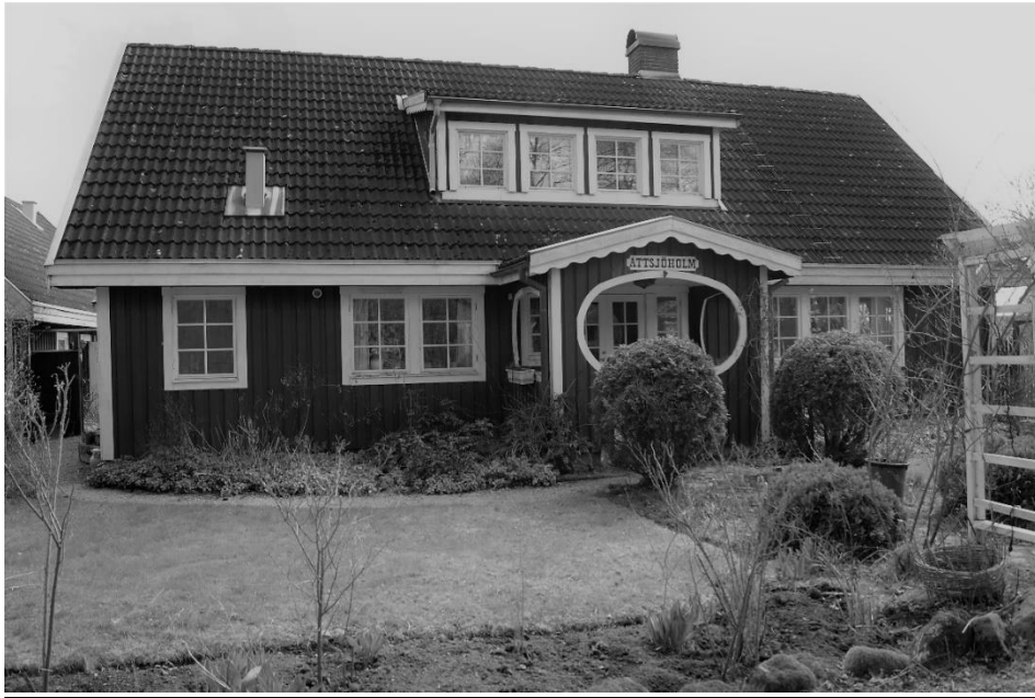
Attsjöholm.