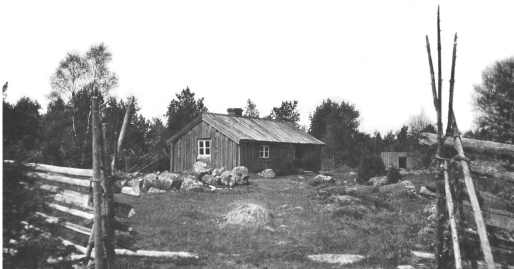
Attsjölyckan 1908.