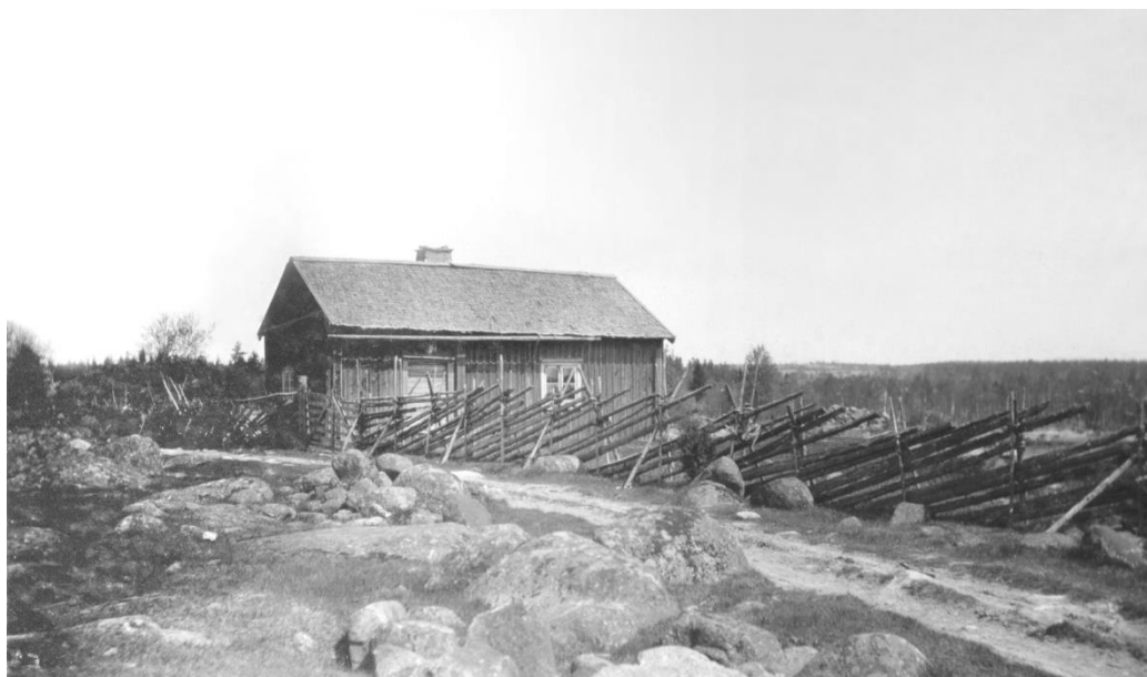
Soldattorp N o 26 längs häradsvägen mot Ramnåsa.