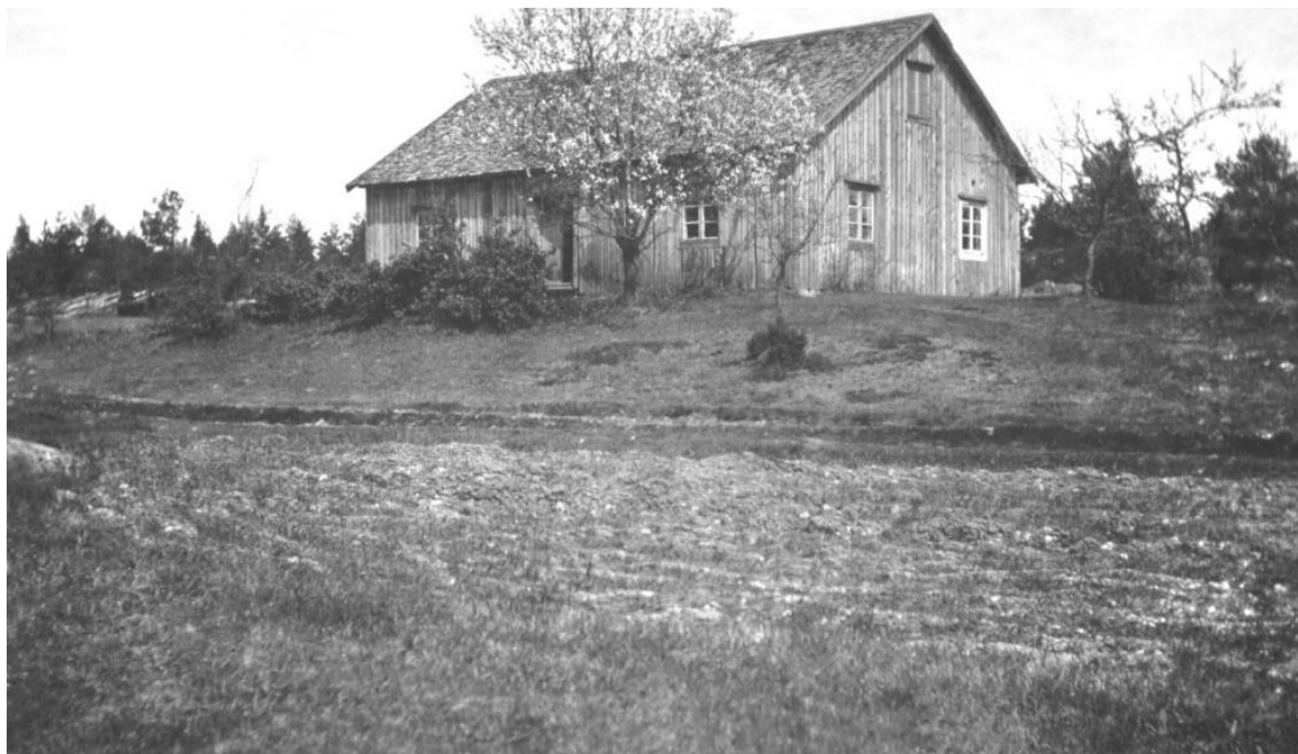
Torpet Johannesdal 1908.