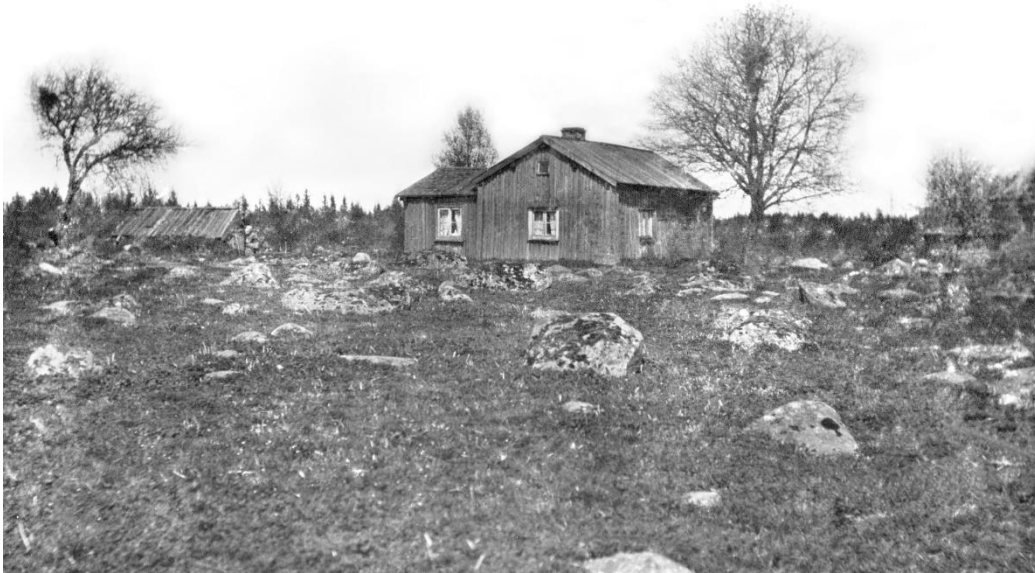
Foto från 1908. Det ursprungliga Lyckanshöjd uppfördes 1839 och var bara 8,6 m långt och 5,1 m brett. Någon gång efter 1890 byggdes stugan till med den bästa delen av det gamla Norratorp. Bara tre familjer har bott på Lyckanshöjd.