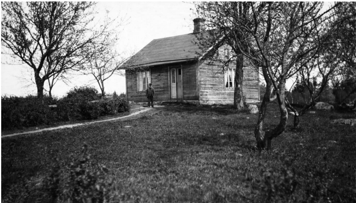
Nils Isaksson fotograferad utanför Nyatorp 1907.

Vid den ekonomiska synen 1900 framkom att torpstugan var i mycket dåligt skick och behövde genomgå en omfattande renovering. Helt ny takstol med nya sparrar, mellanåsar och spantbjälkar måste sättas upp och taket läggas om. Båda gavlarna måste rivas och ersättas med nya och klädseln på resten av huset skulle repareras. I förstugan krävdes nytt golv, ny tröskel och ny ytterdörr. Golvet iorstugan måste läggas om, stengrunden behövde tätas och rappas. Dessutom måste fem fönster med bågar och glasrutor bytas ut och alla fönster och dörrar målas med oljefärg. Allt detta beräknades kosta 214, 50 kronor. Källarens överbyggnad måste rivas och ersättas med en ny. En del av de gamla bräderna kunde användas till att reparera stall och ladugård, vilket också var nödvändigt. Bruket skulle stå för materialet, men enligt torpkontraktet skulle Nils utföra allt arbete och 1905 stod det nya huset färdigt.