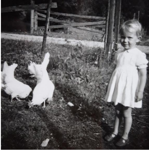
System Gunnel hos hönsen 1961.

-Mamma sålde ägg och innan de började skicka i väg mjölken kärnade hon smör, som hon också tog med sig till affären i Herråkra. Hon bakade matbröd och bullar, men köpte kakor, tårter och knäckebröd av brödknallen, som hade med en liten skåpbil och på höstarna kom sillaknallen. Mattsson åkte runt och sålde underkläder, tyger och klänningar till små barn medan Borstaknallen vandrade till fots och bar på sina borstar som var handgjorda. Om hunden skällde blev han jätterädd och övernattade gjorde Borstaknallen i stallet eller på en madrass på köksgolvet, längre in i huset ville han inte gå.