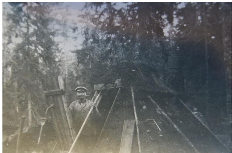
Kolning, troligtvis 1930/1940 i Lenhovda.