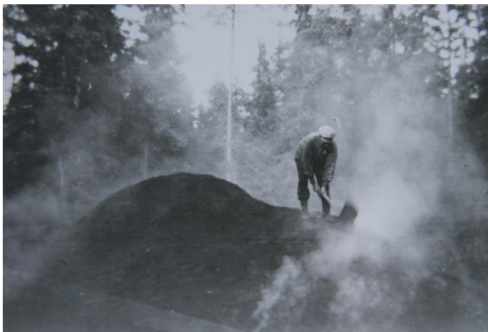
Kolning, troligtvis 1930/1940 i Lenhovda.

Far berättade för mig att runt Nyatorp kolades det mycket. Ibland kunde där vara upp till en tio/femton man och ett russel när de hade milor på gång.