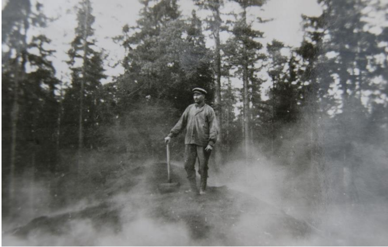
Kolning, troligtvis 1930/1940 i Lenhovda.